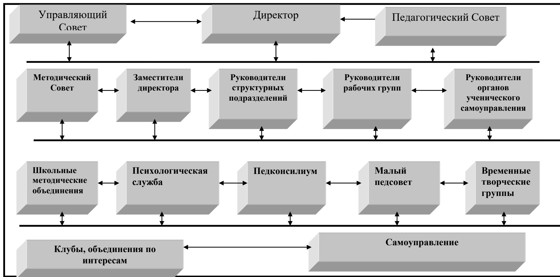
Рис. 1 Структурная модель управления МАОУ СОШ № 5